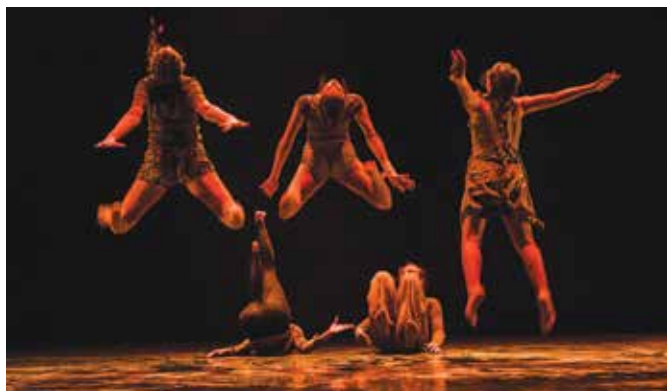
Skupina Plesoluna, koreografija Prah 1944, november 2017, Španski borci.