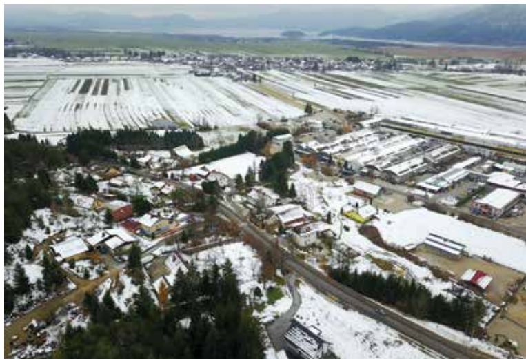
Industrijska cona in regionalna cesta sta življenje v vasi popolnoma spremenili.