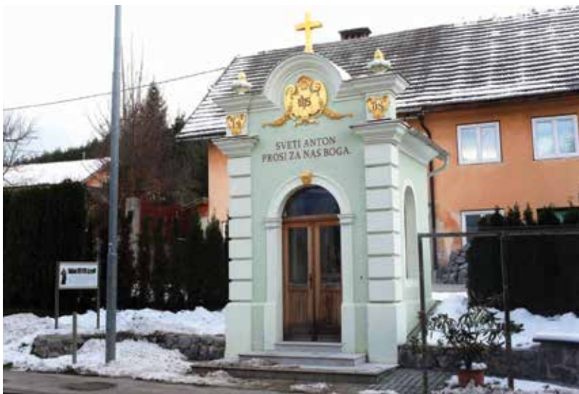
Obnovljeno kapelico so blagoslovili junija leta 2012.