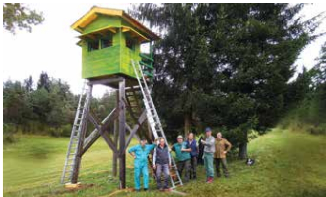
V gradnjo in vzdrževanje lovskih objektov je bilo vloženo veliko prostovoljnih ur.

Letošnji jubilej kaže na to, da smo lovci LD Cajnarje na pravi poti. Še naprej se bomo trudili ohraniti del kulturne in naravne dediščine, vključno z divjadjo in njenim življenjskim okoljem. Želimo si namreč, da bi ga v čim boljšem stanju predali tudi zanamcem. Za to menimo, da se moramo odkrito