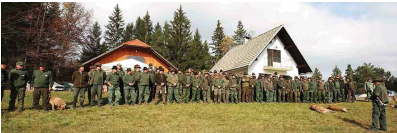
Pozdrav lovini ob praznovanju obletnic LD Cajnarje in LD Žilice pri lovskem domu na Okroglici.

Neokrnjena narava nudi domovanje pestri paleti divjadi. Najpogostejša divjad našega lovišča je srnjad, katere število zaradi najrazličnejših vplivov počasi, a vztrajno upada. Lovci to pripisujemo predvsem porastu številnosti velikih zveri (volka in medveda), občasni prisotnosti šakala, prometu in nestrokovni strojni košnji v zadnjih letih. Na padanje številnosti srnjadi v lovišču verjetno vpliva tudi povečanje števila jelenjadi, ki jo zaznavamo v zadnjih letih. V manjšem številu so na območju lovišča LD Cajnarje prisotni še divji prašiči in gams, od male divjadi pa lisica, jazbec, kuna, divja mačka, divji zajec in druge. Redkeje pa v naše lovišče zaide ris, v zadnjih letih pa je skoraj neopazen tudi gozdni jereb. Kljub nekaj naštetim težavam lahko trdimo, da so populacije glavnih lovni vrst divjadi v dobri kondiciji. V vseh teh letih smo namreč brez večjih težav realizirali postavljene letne odvzeme, ki nam jih predpiše država.