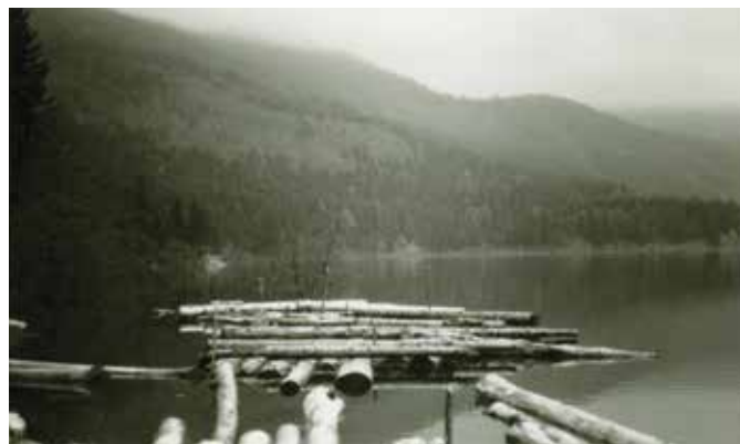
Retje na Cerknškem jezeru, jeseni 1972.

Pri vezanju splava so bili zaposleni najmanj trije delavci in par vprežne živine za privlačenje 2 lesa do vode. Za vezanje splava, v katerem je bilo vgrajeno okoli 50 kubičnih metrov lesa, so potrebovali trije delavci in vprega deset do dvanajst delovnih ur. Splavi so bili široki do štiri metre, dolgi pa, odvisno od količine lesa, ki je bila vgrajena v splav, najmanj pa osem metrov. Les so čvrsto povezali z verigami,